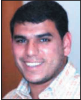
■ بقلم - جعفر ريتيم

إحدى مدلولات إقامة فعالية موسم الامام الصادق (ع) أنها تدل على النضج في التفكير والاهتمام بتقديم النشاط بصورة وبشكل أفضل يتناسب مع روح العصر، وتعد فكرة