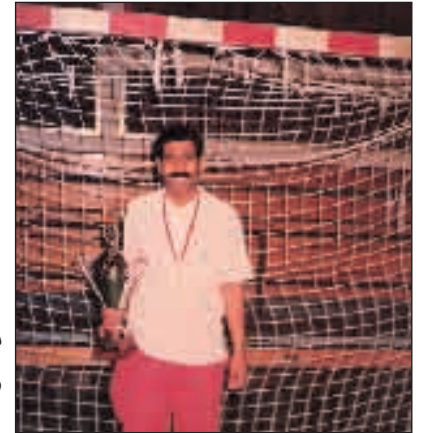
المسيح يحمل كأس بطولة حليب السعودية

لن تفي حقه الكلمات ولا السطور.. رجل أفنى حياته عطاء دون مقابل، هو أحد مؤسسي الصندوق الخيري بالقرية وترأس زمام إدارة النادي لمدة سنة واحدة، عاشق لكرة اليد وأحد مرسى قواعدها في القرية .. فكانت لنا معه هذه الوقفة السريعة ..