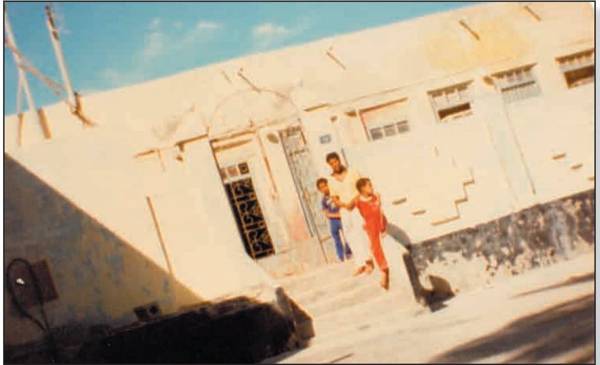
صورة قديمة لمأتم العالي سنة 1986م