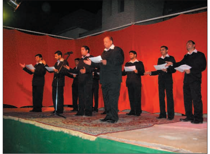
جانب من مهرجان الغدير الإنشادي الأول