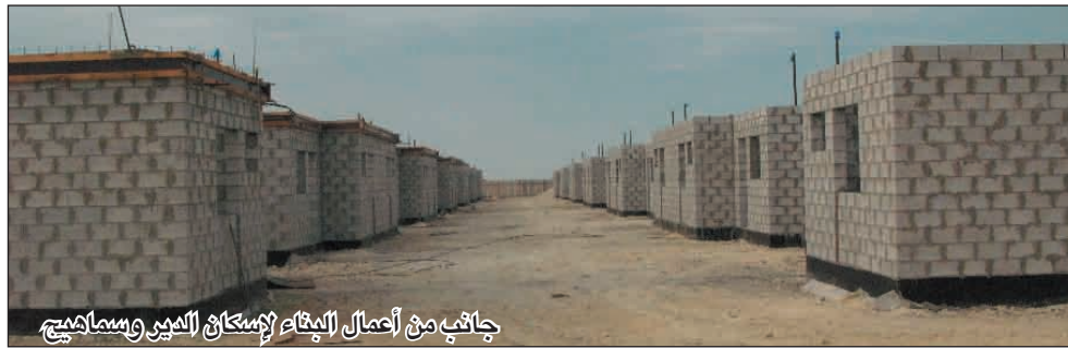
جانب من أعمال الإنشاء لسكان الكهين وسماهيح