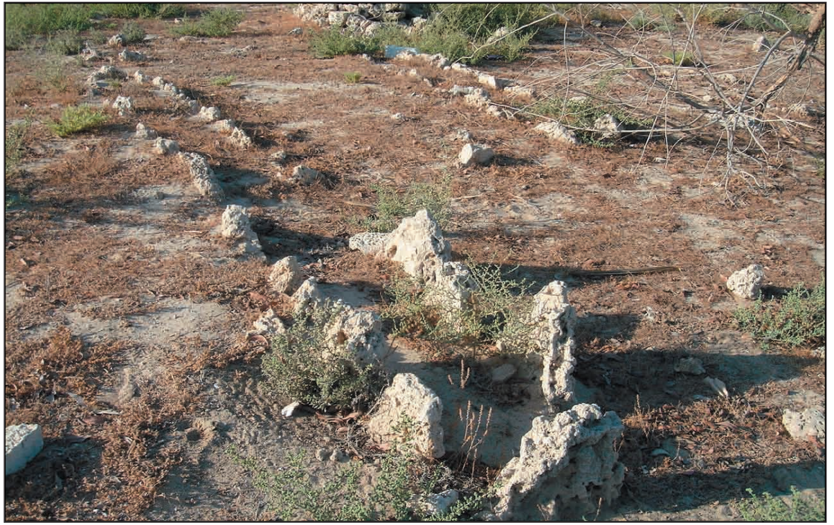
■ مقبرة عبيد الصلاح