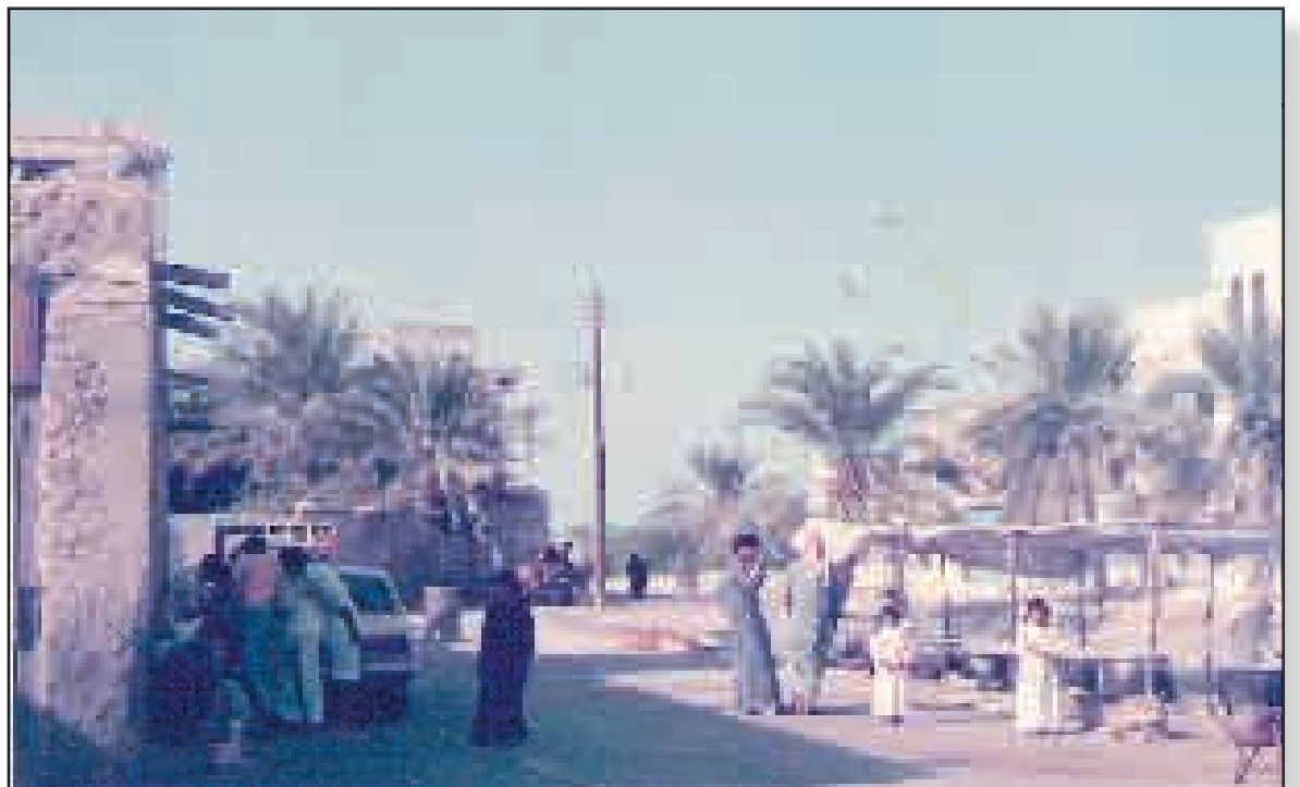
■ تصوير حسن أحمد مسعود