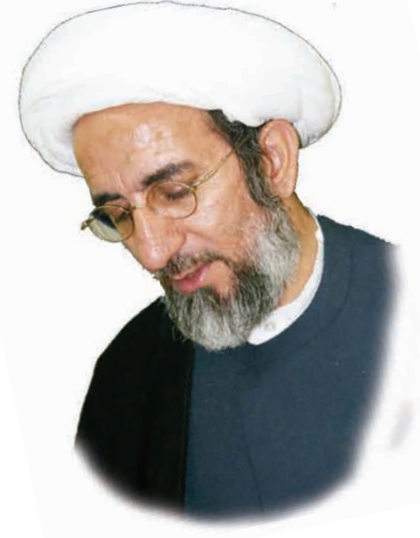
□ الشيخ حبيب الكاظمي

إن من المواضيع المهمة التي تناولها القرآن الكريم في آيات عديدة: موضوع شرح الصدر.. ولا يخفى ما لشرح الصدر من دور بارز في تحقيق النجاح على المستوى الفردي والاجتماعي، ومن هنا فإن الله تعالى قد من على حبيبه المصطفى (ص) بشرح الصدر، حيث قال تعالى في سورة الشرح: ﴿أَلَمْ نَشْرَحْ لَكَ صَدْرَكَ﴾ وفي آية أخرى نلاحظ بأن موسى (ع) يطلب من الله تعالى شرح الصدر، ليستعين بها على هداية فرعون، قال تعالى: ﴿قَالَ رَبِّ اشْرَحْ لِي صَدْرِي﴾. قال تعالى: ﴿أَفَمَنْ شَرَحَ اللَّهُ صَدْرَهُ لِلْإِسْلَامِ فَهُوَ عَلَى نُورٍ مِّنْ رَبِّهِ فَوَيْلٌ لِلْقَاسِيَةِ قُلُوبُهُمْ مِّنْ ذِكْرِ اللَّهِ أُولَئِكَ فِي ضَلَالٍ مُّبِينٍ﴾.. من الواضح أن هناك تقسيماً في هذه الآية أساسه انشراح الصدر، وخلاصته بأن المسلم المنشرح صدره يتقبل الدين بكل وجوده، بخلاف ضيق الصدر الذي قد يكون إسلامه إتباعاً لأبائه وأجداده، أو ضرورة بيئية، أو ما شابه ذلك.. ومن هنا فإن الأول يكون على نور من ربه، بينما الثاني فهو على ضلال مبين.. ومن المؤكد أن المؤمن يحتاج إلى هذا النور في شتى شؤون حياته: إقداماً، أو إجماعاً.. فإن السائر على غير هدى -كما في الروايات- لا تزيده كثرة السير إلا بعداً.